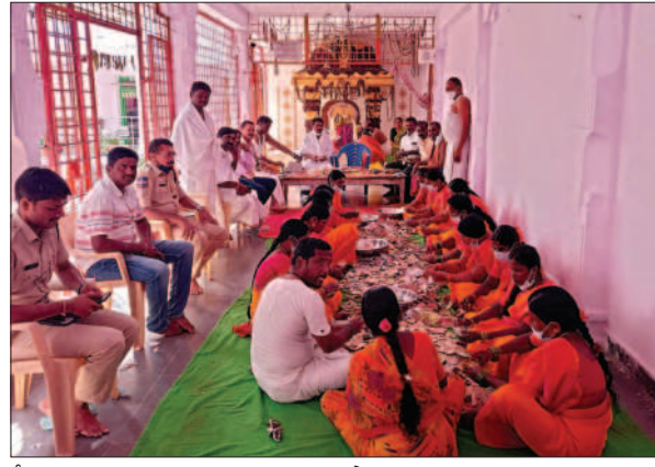
సేవాసమితి కొత్తకొండ సభ్యులు పాల్గొన్నారు.