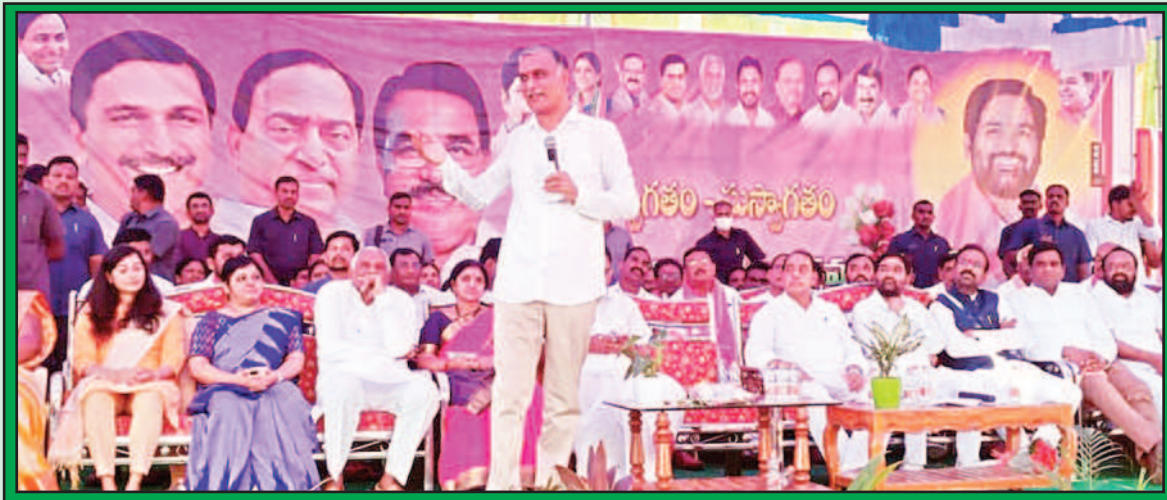
బెల్లంపల్లి, ప్రభాతవార్త :